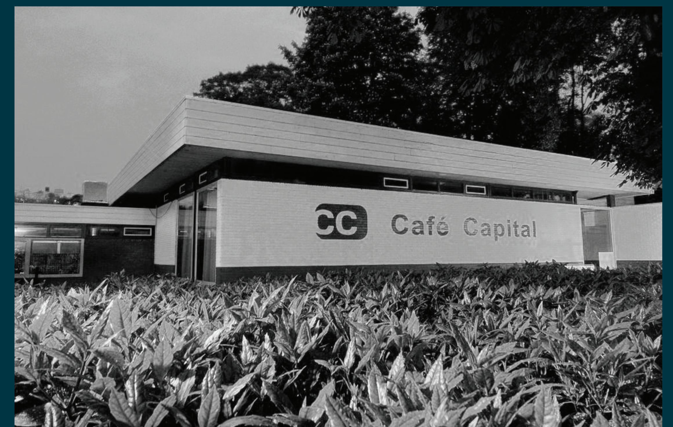
Café Capital: 1975