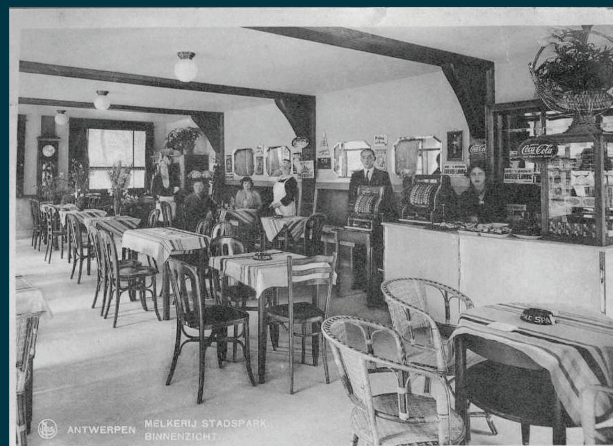
Oorspronkelijk interieur Melkerij stadspark: 1933