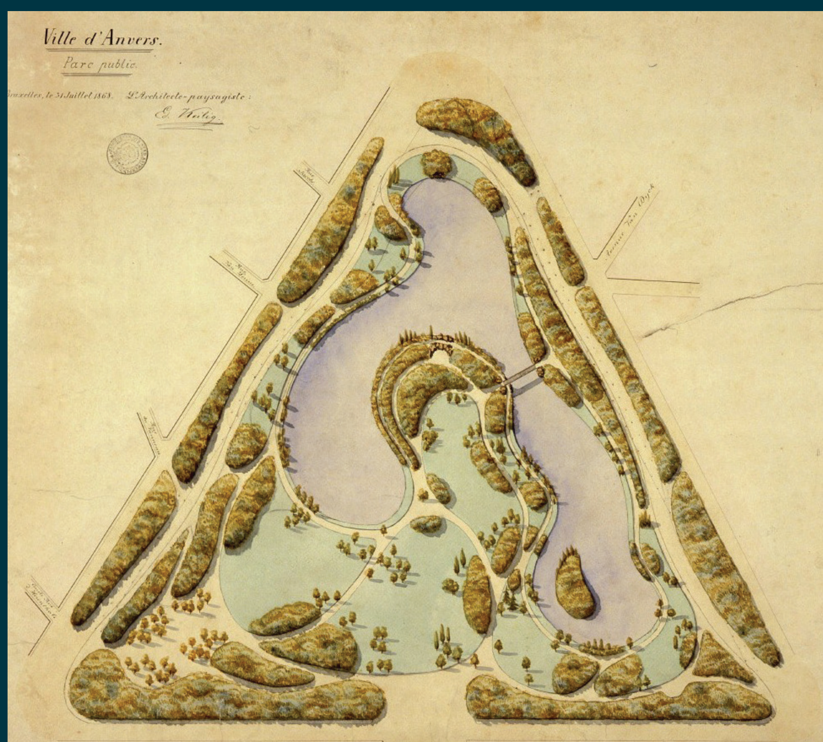
Historisch plan stadspark: 1869 (Eduard Keilig)